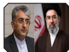
پیام شهردار بندرعباس به مناسبت انتخاب حضرت آیت الله سید مجتبی حسینی خامنه ای به عنوان سومین رهبر نظام مقدس جمهوری اسلامی ایران