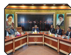
نسیم نوروز در شهر؛ آغاز هماهنگی ها برای بهاری متفاوت در بندرعباس