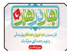
پیام شهردار بندرعباس به مناسبت نوروز ۱۴۰۵ و عید سعید فطر