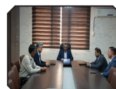
ارائه برنامه های سال ۱۴۰۵ مدیران مناطق چهارگانه به شهردار بندرعباس