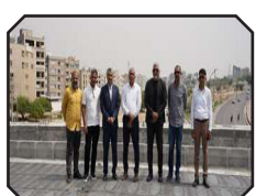
تأکید شهردار بندرعباس بر تسریع در تکمیل تقاطع غیر همسطح شهید تختی نژاد (مهرگان)