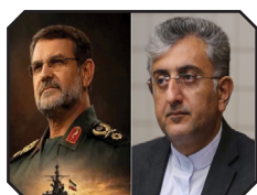
پیام شهردار بندرعباس به مناسبت شهادت سردار تنگیبیری فرمانده نیروی دریایی سپاه پاسداران انقلاب اسلامی ایران