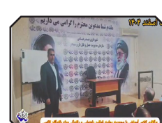
دوره آموزشی با محوریت رعایت قوانین راهنمایی و رانندگی ویژه رانندگان تاکسی و اتوبوس بندرعباس برگزار شد