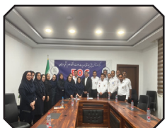
اورژانس خط مقدم حضور موثر در بحران ها و تضمین کننده سلامت و درمان به موقع شهروندان است