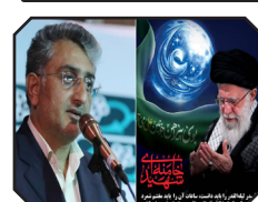
پیام تسلیت شهردار بندرعباس به مناسبت فرا رسیدن شبهای قدر، سالروز ضربت خوردن و شهادت حضرت علی (ع)