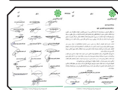
تجدید میثاق شهردار بندرعباس با آرمان های انقلاب در مجمع شهرداران کلان شهرها و مراکز استان ها