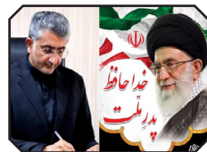
اعلام سوگ و توصیف شخصیت